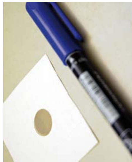
Tato titěrná ocelová mřížka simuluje při zkouškách filtr

Při hodnocení přípravků pro zlepšení nízkoteplotních vlastností nafty je na prvním místě schopnost zajistit provoz i při největších mrazech, což má v některých případech cenu zlata. Pochopitelně, je ale důležitá i cena za dosažení této vlastnosti vyjádřená v korunách (tabulka číslo 6). Náklady na aditivaci jednoho litru nafty byly již uvedeny v tabulce 2, ale bez zahrnutí