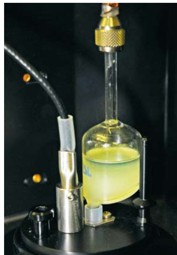
Hranice filtrovatelnosti se určuje opakovaným plněním a vyprazdňováním baňky podchlazenou naftou

Jako základní zkouška charakterizující nízkoteplotní vlastnosti byla vybrána filtrovatelnost, a protože studený zimní start ovlivňuje i cetanové číslo paliva, bylo rozhodnuto, že bude také provedena zkouška na přítomnost nitrátů v přípravku. Jsou to látky zvyšující ce-